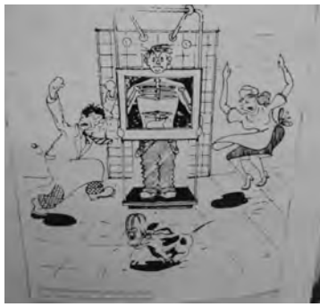
▲エックス線撮影の漫画

ノーベル賞受賞を記念して、大学内にはレントゲン記念館が建てられており、中にはレントゲンにゆかりのものが展示されています。展示物の中でおもしろかったのは、エックス線撮影の様子を描いた漫画でした（写真）。真ん中の男性の写真には、