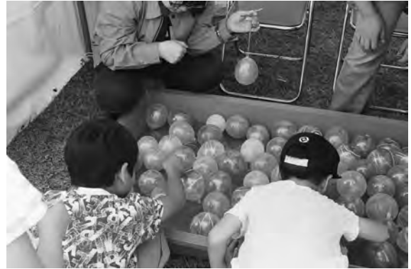
子供たちに大人気の縁日