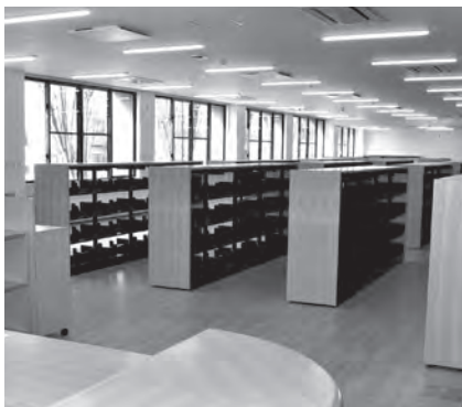
▲新設された図書館の書棚

千代田交流センターは3月末までに整備を終えましたが、図書館分館と公民館はその後、本や資料整備などの開館作業を行い、5月6日(木)にオープンする予定です。2、3階の会議室やホールなどの貸し出しについては、4月26日(月)から予約を受け付ける予定です。