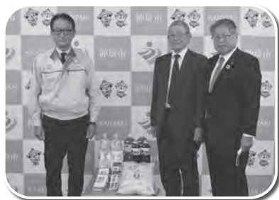
トヨタ紡織九州(株)