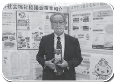
コープさが生活協同組合