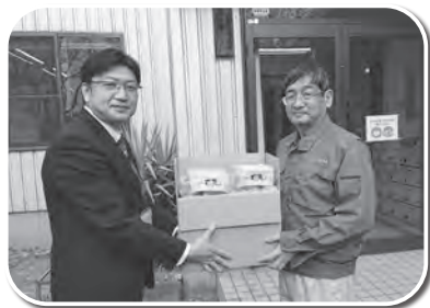
ホーリョウ商事(株)