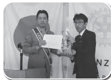
神崎ロータリークラブ