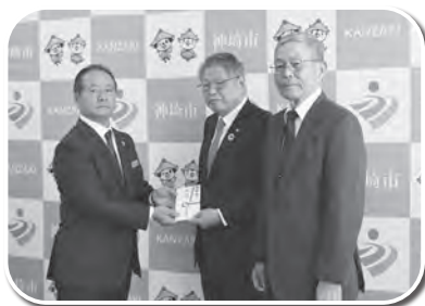
佐賀県農業協同組合