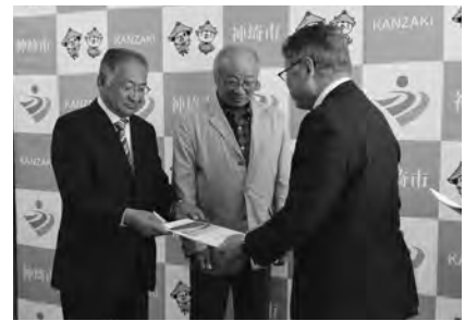
(左から) 中島千代田町区長会長、吉村神埼町区長会長

要望を受け、市では、近年の異常気象に伴い年々災害リスクが高まっていることを踏まえ、1日でも早く市民の安全・安心を実現するため、これまで以上に引き続き国や県への要望を行っていきます。