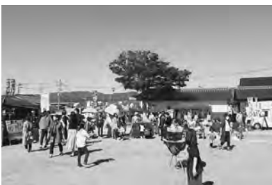
▲門前広場を活用した「櫛田の市」の様子

○活用例 ・飲食、販売イベント ・コンサートなどのステージイベント(ステージ貸出可) ・ヨガなどの健康教室