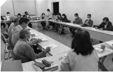
▲脊振笑おう会 話し合いの様子