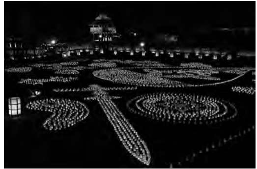
昨年のキャンドル入り紙灯ろうによる地上絵