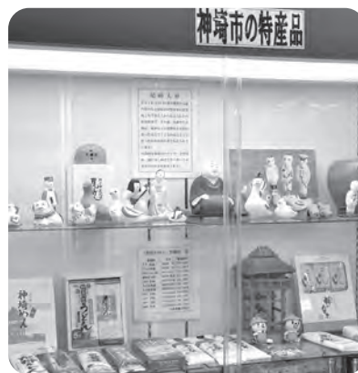
▲特産品のショーケース

かんざき遊学館朝市「幸せマルシェ」は、旧「吉野ヶ里遊・学・館」から引き続き、毎月第2日曜日の9時から11時まで開催します。開催日当日限定で、かんざき遊学館の入り口付近に“サプライズ”でお店が出店します。