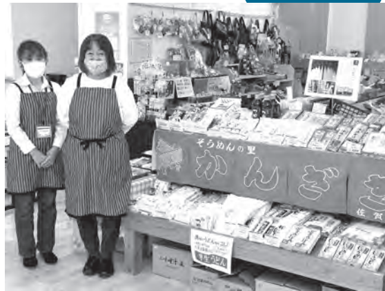
▲地元産品がずらり

市内の名所や観光スポットを案内しています。移転オープン以来、市役所や中央公民館などを利用された人も立ち寄られるようになり、お客さんは移転前より増加。目玉商品と見込んだ「神埼桑菱茶」は入荷するとあつと