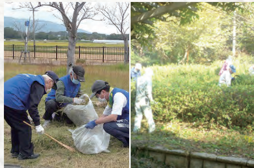
神埼ライオンズクラブ