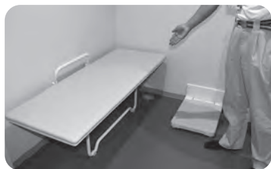
▲ユニバーサルシート

防災拠点として安全安心の機能を高め、災害時には情報を集め、対策を素早く発信できるように3階に機能を