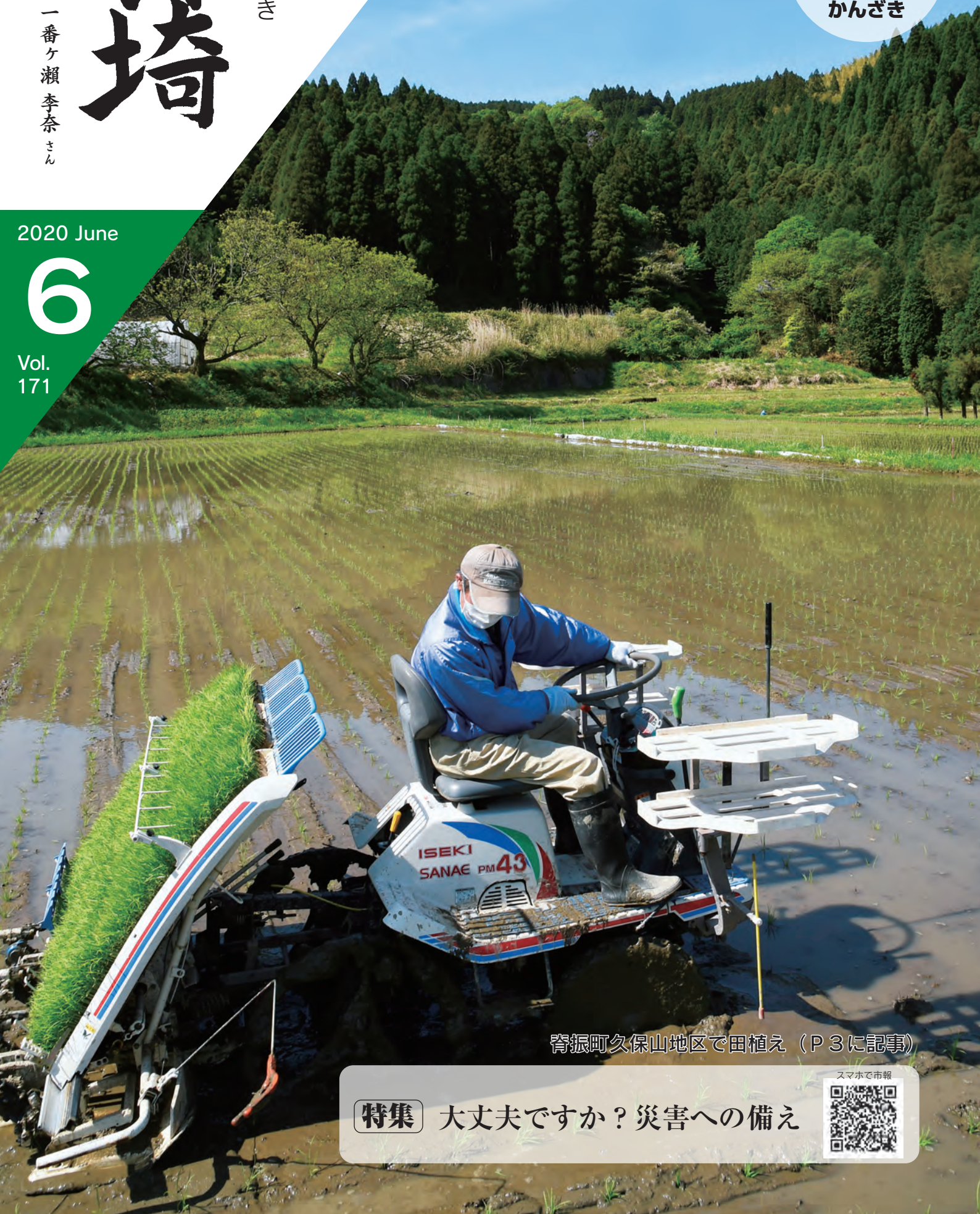
脊振町久保山地区で田植え（P 3に記事）