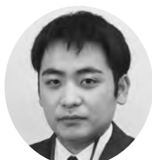
福井 走 農政水産課