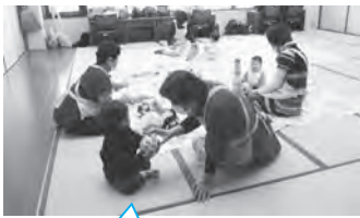
神埼市の子育てを一緒に盛り上げていきましょう！

子育てをサポートする仲間とともに、子どもたちの笑顔と明るい神埼市の未来のために、活動してみませんか。