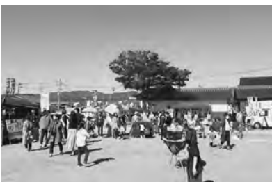
▲門前広場を活用した「櫛田の市」の様子