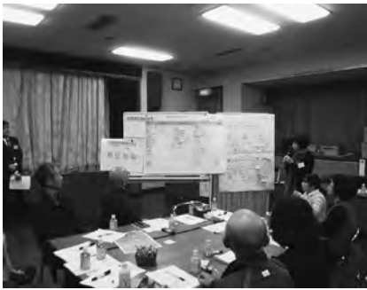
▲第2回ワークショップの様子

第1回目のワークショップでは、城原川ダム周辺地域および上流域の魅力と課題などについて意見交換が行われました。「地域の魅力」では、主に、自然環境の豊かさや歴史・文化資源、地域コミュニティなどの意見が出され、「地域の課題」では、主に、