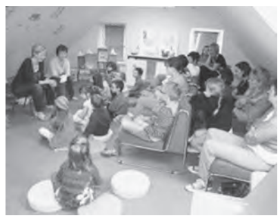
童話の読み聞かせイベント

ポークール市には、メディアテークと呼ばれる情報資料館があり、本・CD・DVD等の貸出を行っています。利用には登録が必要で、サービス内容によって、年間の利用料金がかかります(例:本の貸出のみ約600円、本・CD・DVDの貸出約1,200円)。18歳以下の市民は無料で利