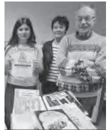
クイズ大会に参加した参加者

用できます。人口の約15%に当たる800人が登録しており、高齢者や障がいのある方にも配慮し、月に一度配達サービスも実施されています。 情報資料館では、子どもから大人まで楽しめるイベントも開催されています。子育て関連イベントとしては、毎月、乳幼児を対象に、童謡の歌に合わせた手遊び等が行われています。また、幼稚園児・小学生を対象とした童話の読み聞かせや、若者・大人を対象としたDIY講座も開催され、大変人気があるそ