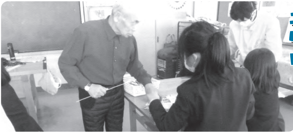
▲ドリームパークで凧づくり

日々の生活を豊かにし、健康づくりにもつながる趣味。地域でのふれあいなど、趣味を通して生き生きライフを送っている人びとをシリーズで紹介します。