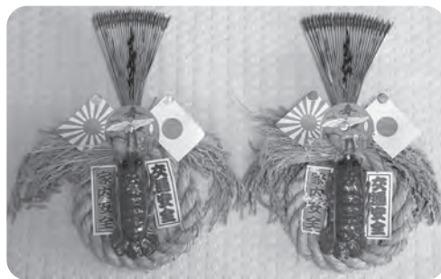
【わらの丸い形が特徴のしめ縄】