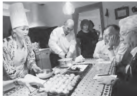
料理交流を行う神崎市代表团

した。昨年10月、神崎市代表团がボークール市を訪問した際、料理を通じた交流で、フランスの伝統的な焼き菓子であるパタシュー(シュー生地)作り体験を行いました。材料は、①水・牛乳・塩・砂糖・バター、②小麦粉・たまごです。鍋で①を加熱後②を加えて混ぜ、好みの大きさに形を整え、