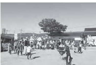
▲門前広場を活用した「榊田の市」の様子