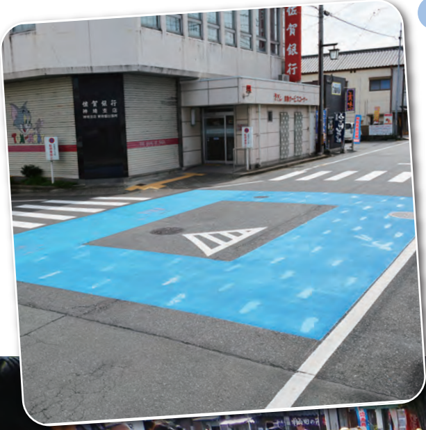
サガブルー プロジェクト(P3に関連記事)