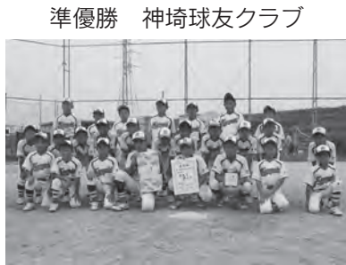
準優勝 神埼球友クラブ