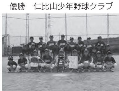
優勝 仁比山少年野球クラブ