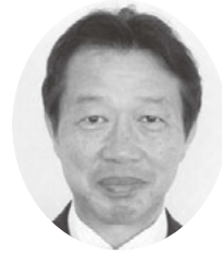
白石 昌利 議員

議員 地域全体で高齢者を支える仕組みづくりの促進及び住民の地域福祉活動と公的福祉サービスの繋がり改善する役割