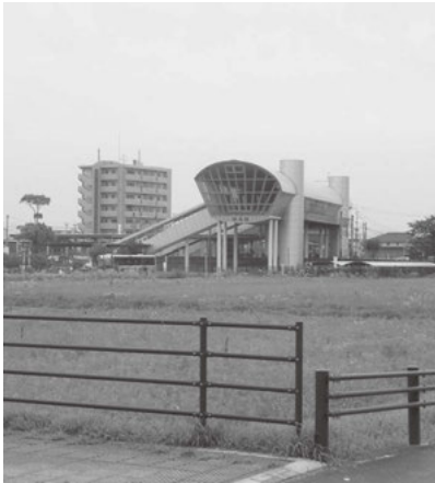
未整備のままの駅北口周辺

を創設して事業を実施し、人口の社会増に一定の成果が上がっているが、千代田東部・脊振地区では交付実績が伸びていないのが課題とされています。