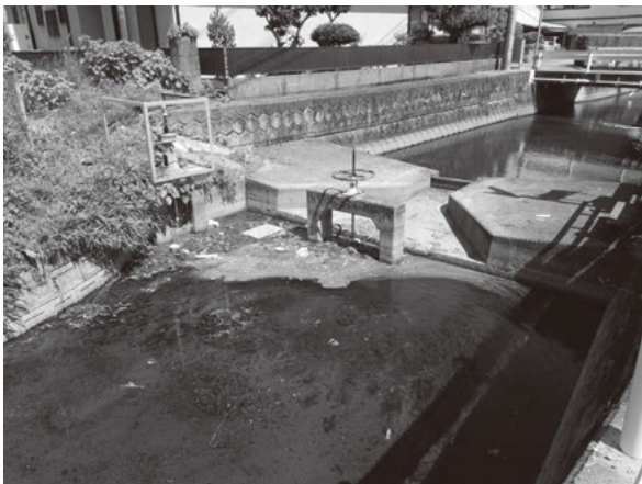
川を汚さないでね