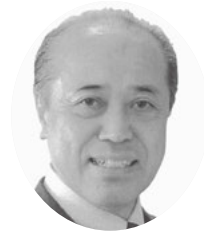
木原 憲治 議員

議員 今年4月より大企業を先行して、働き方改革関連法が施行され、具体的には3つの課題として、長時間労働の是正、非正規と正規の格差是正、労働人口不足(高齢者の就労促進)が、最重要事項となっている。また2020年4月からは同一労働同一賃金も施行予定であるが事前のガイドライン等の整備は出来ているのか。