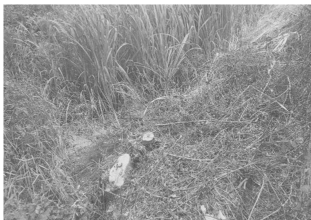
姉川西分笹原の立木を切ったあと

嶋産業建設部長 農業水路などの維持管理については、利用されている地元でお願いしています。地区の作業では対応が困難なときは、農業用水路や農道については、多面的交付金事業で、対応してもらっています。