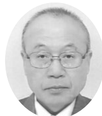
吉田 守 議員