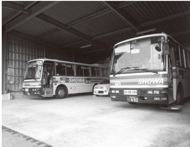
待機する脊振町通学バス

市といたしましては、昭和自動車のバス路線が廃止された場合においても、住民の日常生活に影響が生じないように、移動手段の確保に向け鋭意努力してまいります。