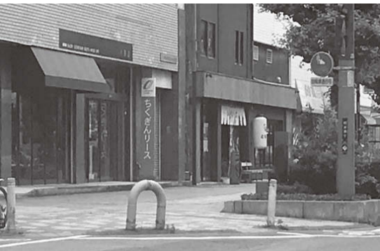
久留米市の交差点 (鉄製ポール型の車止めが設置)

久留米市の交差点では、歩道内への車両進入を防止する目的で、鉄製ポール型の車止めが設置されています。神崎市でも、歩行者が多く、交通