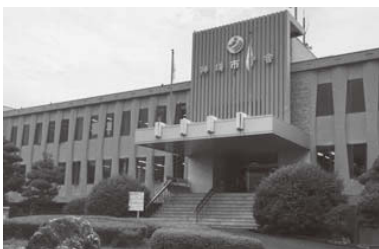
働き方改革で職員の処遇が改善される予定の市役所