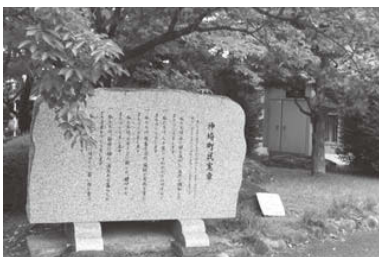
旧神崎町時代の神崎町民憲章の石碑