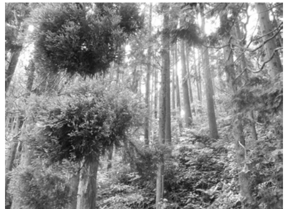
脊振の森林の様子

A 基金の積立から市として使う場合には、一般会計として計上し、その中で切り崩して財源として充当して使うことになります。一般会計で歳入・歳出、それぞれ予算化を計上しますので、その時に用途の説明もいたします。