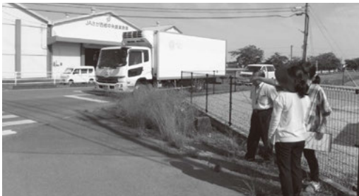
行政と保育士による散歩コースの安全点検の様子

八谷福祉事務所長 点検と安全管理の徹底を各園に依頼した。今後も定期点検と日々の交通安全の徹底を継続していく。