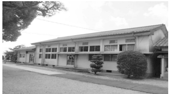
黒津児童館の現状

A 児童館ではなく、千代田町保健センターの補完機能として、ふれあいの場、遊び場を提供したいと考えております。