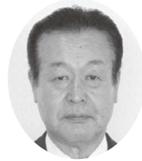
箕原 忍 議員