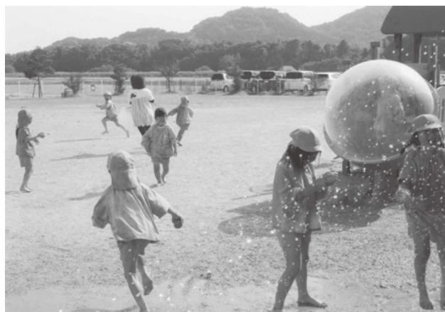
園児生活を通じてすくすく育つ子供たち

福祉事務所長 令和二年度までの子育て安心プランで約32万人の受け皿整備を国は目標にしているが、解消には至っていない。