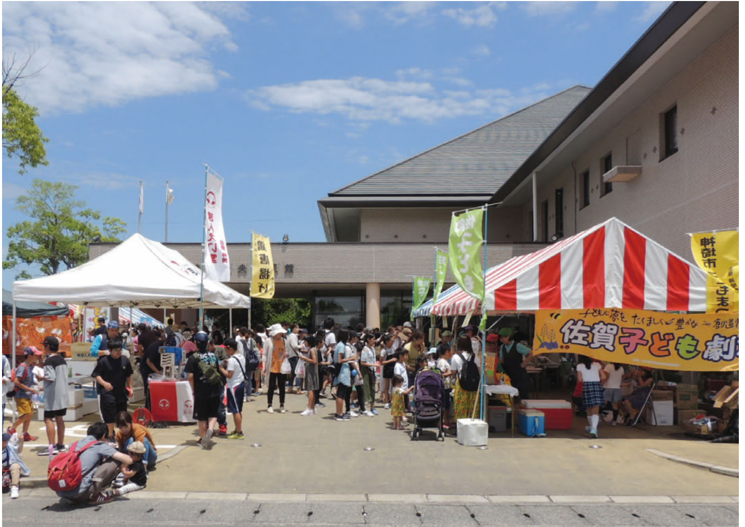
露店では多くの人で賑わい、子どもまつりを盛り上げる(6月23日開催)