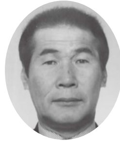
宮島 清 議員