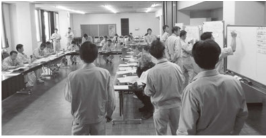
大規模災害にそなえた訓練の様子

議員 気象庁や自治体は、洪水や土砂崩れ、地震、火災による被害を防ぐため、住民に注意報や警報、避難準備、避難勧告、避難指示などの情報を発表している。そのような状