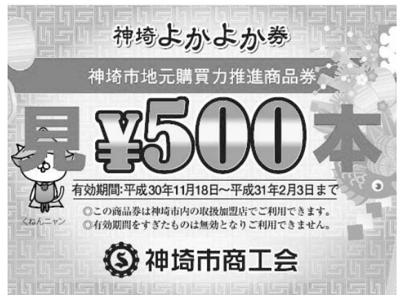
平成30年度の神崎市地元購買力推進券(見本)

A ・使用できる店舗は、市内の登録店舗という事で実施します。 ・平成30年度の実績を申しますと、99.73%を換金しております。