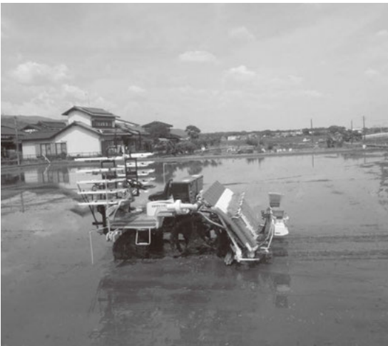
無人田植機の実証実験