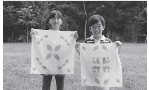
アイの葉を使った叩き染め