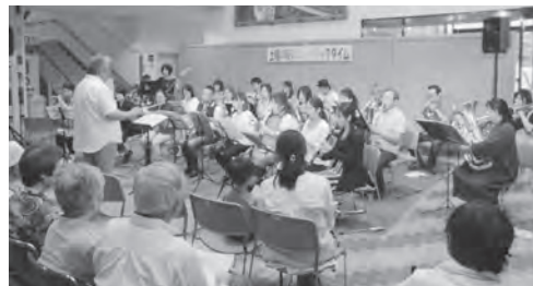
▲6月は「さが吹奏楽団」さんたちによるジャズ演奏でした。