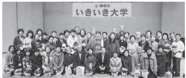
▲パーフェクト賞44人のみなさん

4月1日から新年度の受付を開始します。あなたが一番大切な人と一緒に自分探しを始めませんか？