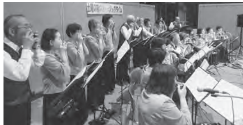
▲3月は「ハーモニカアンサンブル コン・カローレ佐賀」さんたちによるハーモニカ演奏でした。