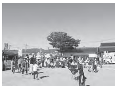
▲門前広場を活用した「櫛田の市」の様子

イベントや団体で「門前広場」を利用しませんか ◎問い合わせ 企画課 企画係 ☎37-0102