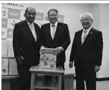
▲「幸せつなごうキャンペーン」抽選会

また、3月22日、贈呈式を行い、特賞当選者に賞品を贈呈しました。ご応募いただいた皆さま、ありがとうございます。 ※特別賞（株）ヤクルト本社佐賀工場協賛）、わくわく賞、きらきら賞当選者は、市ホームページに掲載します。