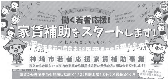
▲若者応援家賃補助事業

平成31年度当初予算の編成については、第2次神崎市総合計画実施計画を反映し、計画に掲げる事業の着実な取り