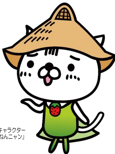
神崎市マスコットキャラクター 「くねんワン」「くねんニャン」