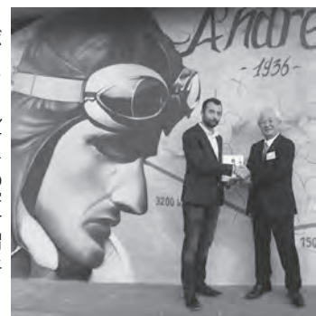
【情報提供】ボークール市