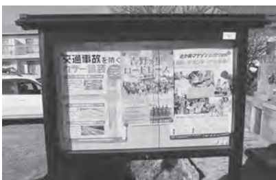
本堀地区 屋外掲示板整備(4箇所)

(財)自治総合センターが、コミュニティ活動の助成を行い、コミュニティの健全な発展を図り、宝くじの社会貢献広報事業を行うことを目的に実施されています。