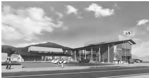
▲脊振町複合施設イメージ図

今回の一般会計の補正予算において、歳入歳出それぞれ9億3,132万5千円を追加し、平成30年度一般会計の歳入歳出予算の総額が、それぞれ165億1,268万2千円となりました。