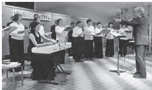
▲11月は「合唱団F」さんたちによる混声合唱でした。