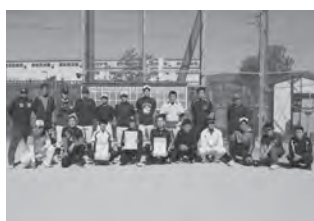
Aパート 優勝 姉 準優勝 迎島