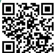
くねんニャン のアカウント

みんなからの投稿を待ってるニャン！！ 僕もInstagramとfacebookで情報を 発信するニャン！見てニャン！！