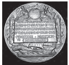
受賞した銅メダル

明治26年、日本も参加したシカゴ万博には、全国から様々な工芸品や美術品が出品されました。その中で、原岡家で作られた蠟が優良品として銅賞を獲得しています。