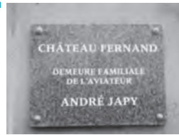
入口に設置されたプレート(上) シャトーの外観(下)