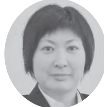
木附 唯 福祉課 仁比山保育園