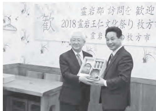
田郡守(右)と副市長 記念品交換を行う