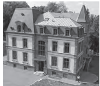
【情報提供】ボークール市