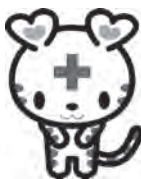
日本赤十字 公式マスコット キャラクター ハートラちゃん