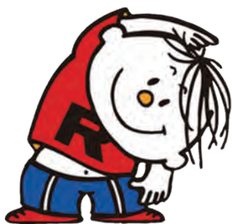
イメージキャラクター ラタ坊