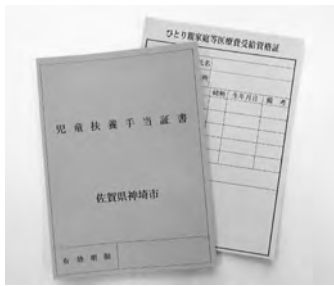
▲上記証書をお持ちの方はご持参ください。

ひとり親（母子・父子など）家庭の方が、健康保険により病院などの医療機関で診療を受けた場合、医療費の自己負担金を助成します。 助成を受けることができる額は、保険適用となる医療費の自己負担分で、対象者1人につき各月500円を差し引いた金額となります。