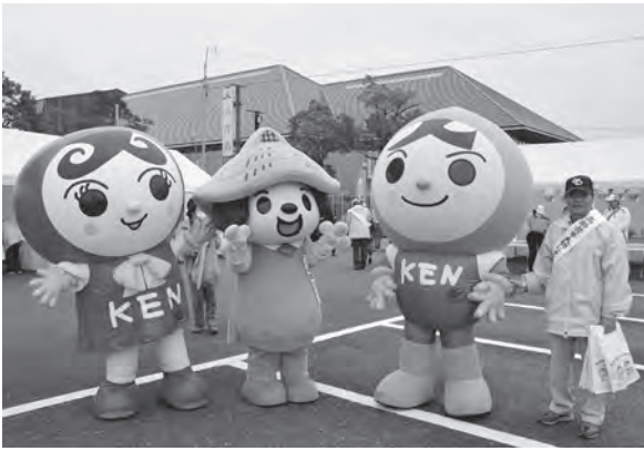
▲市民交流祭での様子

また、12月の人権週間には、広報車で呼びかけを行うなど市民の皆さんの人権に対する意識を向上させるため活動しています。