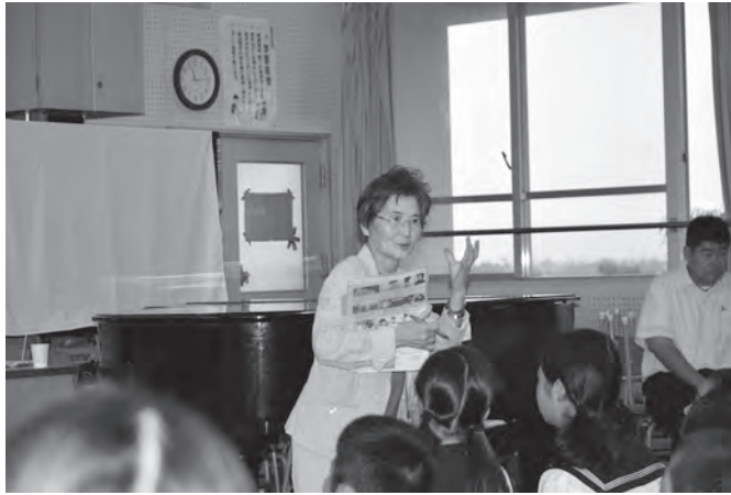
▲千代田中学校での人権教室の様子

人権擁護委員は、人権擁護委員法に基づいて人権相談を受けたり、人権の考えを広めたりする活動をしている民間ボランティアです。