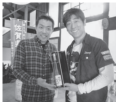
▲「すまいる大御殿」で紹介