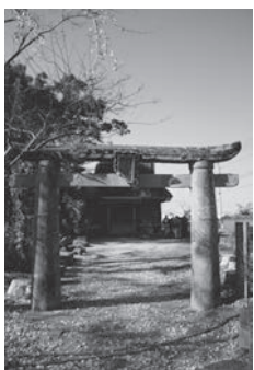
▲若宮神社の石造肥前鳥居

昭和57年から行われたほ場整備事業による発掘調査では、貝塚を伴う湿地帯だったため、通常では残っていない有機質の遺物がたくさん発見され、さながら情報の宝庫といえる遺跡です。中でも、水鳥をかたどった「鳥形木製品」は全国でも4、5例しか出土していない大変珍しいものです。同じく木製の机や椅子を見ても、当時の人々が非常に高度な木工技術を持っていた事が分かります。