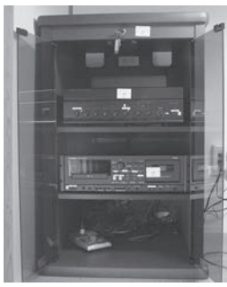
▲三谷公民館内ラック型アンプ

この事業は、(財)自治総合センターが、コミュニティ活動の助成を行うことにより、コミュニティの健全な発展を図るとともに宝くじの社会貢献広報事業を行うことを目的に実施されています。