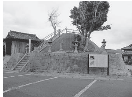
◀長崎街道に唯一残る ひのはしら一里塚