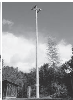
▲屋外放送施設スピーカー