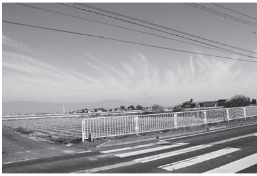
▲現在の詔田西分遺跡一帯

千代田庁舎前を通る国道264号沿いの詔田西分遺跡は、弥生時代集落跡の中でも拠点的な集落跡だったようです。