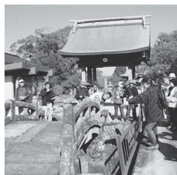
▲石橋を見学する参加者

ここに鎮座するのは、白角神社・櫛田宮と並ぶ、神埼荘の三所大明神のひとつ高志神社です。境内を囲む堀には1700年代に造られた石橋が架けられていて、石工は、牛津の砥川の平川氏と記録が残っています。