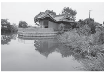
上黒井の熊野神社と堀

大石から西へ向かい約200メートル四方の「上黒井環濠集落」に至ります。東端に熊野神社があり、「屋敷」や「鎌倉」