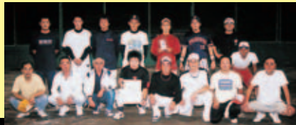
▲優勝した崎村地区

町内から26地区が参加して行われた大会は、崎村地区が優勝、高志地区が準優勝、姉地区が3位(得失点による)の成績をおさめました。