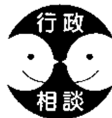
行政相談シンボルマーク

登記、道路、年金、福祉など毎日の暮らしの中で、役所の仕事についての苦情や意見・要望はありませんか？