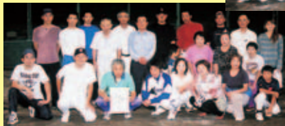
▲準優勝した高志地区