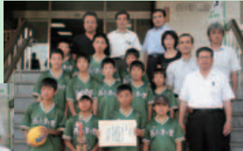
▲〈男子〉西小津ヶ里地区