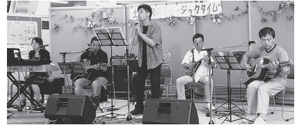
▲8月のミュージックタイム

親子で、ご家族で、また、お友達とお誘いあわせのうえ、ぜひご参加ください (入場無料)