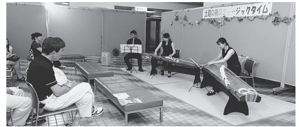
▲7月のミュージックタイム