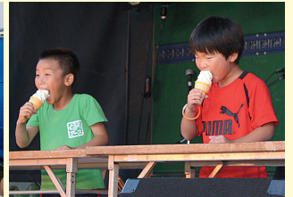
熱い戦い、アイスの早食い