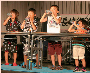
1位になるぞ ラムネの早飲み