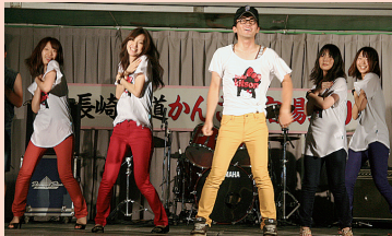
見事2連覇！佐賀銀行チーム