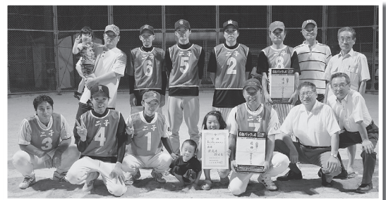
▲Aパート優勝の二子チーム