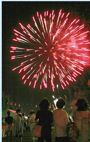
華麗なフィナーレ