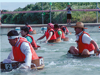
決戦、ハンギー競漕