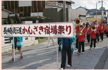
にぎやかにパレード