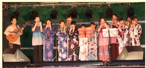
オカリナの音色が響き渡りました