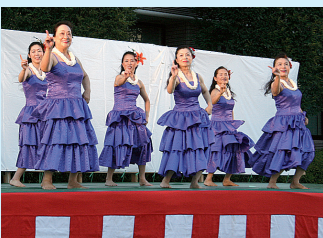
フラダンスに盆踊り