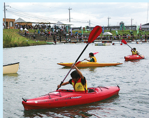
大人気カヌー体験