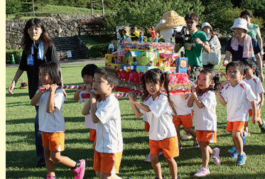
おみこし、わっしょい！