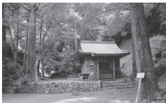
◀後鳥羽上皇を祀る後鳥羽神社