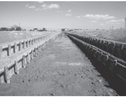
▲間伐材を用いたクリーク整備

一方、市北部には約5千haの森林がありますが、木材価格の低迷や高齢化による労働不足により、適切な管理が行えない状況にあります。このため、クリークの保全と山林の保全の両方を組み合わせた事業として、平成23年度に、市有林の間伐材等を利用した、クリークの法落ち対策事業（土地改良モデル事業）を実施しました。また、本年度から県営クリーク整備事業において、市内クリーク180kmを概ね10年間で木柵工により整備を進める計画となっています。