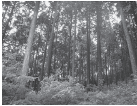
▲間伐が必要な森林

市南部の平坦地域のほ場整備事業で造成されたクリークは、法面の崩落が著しく、営農を行っていく上で農作物の搬送や農業用機械の通行に大変支障をきたしています。