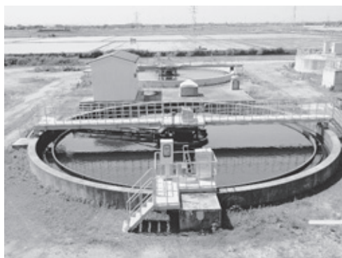
▶現在日量約2,000立方メートルの汚水を処理している浄化センターの最終沈殿池

しかし、トイレの水洗化率は県平均レベルに達しておらず、まだまだ整備の拡大が必要です。近年の厳しい財政状況の中で、経済的・効率的な整備を進めていきます。