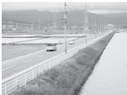
▲市道国管千代田西1号線

このため、平成19年度に神埼町の中心部と千代田町の中心部とを結ぶ市道国管千代田西1号線の整備に着手しました。本路線は、片側歩道付の2車線道路で、平成23年度末には、神埼町から国道264号間の整備をほぼ終えたところであり、今後更に南進し、県道佐賀・八女線まで整備を行なうことになっています。