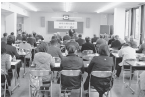
▲神崎市観光協会設立総会

観光協会の統合については、合併時、調整がつかず、脊振町と神崎町にそれぞれ観光協会が存続することになりましたが、昨年、神崎市観光協会設立準備会が設立され、約1年間にわたる協議調整をなされた後、今年1月26日に神崎市観光協会が設立されました。