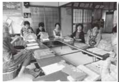
オレンジの家読バックをもって公民館へ集まります。