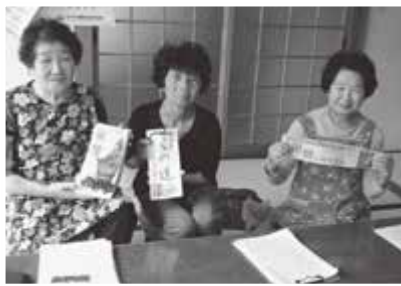
家読参加者が新聞を切り抜き、1冊の本に仕上げました。3冊できています。