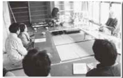
初めてのおはなし会