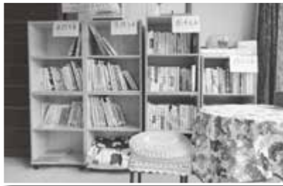
家読文庫、新井文庫、猪面文庫と揃いました。