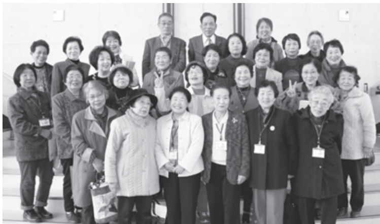
▲パーフェクト賞受賞の皆さん 晴れやかに

いきいき大学は60歳以上の方の出会い・ふれあい・学びの場です。14回の講座では、様々な分野の講師を県内外からお呼びして、健康に過ごすためのヒントや、郷土の歴史、文化の薫り高いお話や心にしみるいいお話など、たくさんのお話を聞くことができます。都合の良い時、聞きたい講座だけの受講でかまいません。6歳を過ぎればいきいき大学入学資格ができます。平成24年度は4月2日から受付開始です。