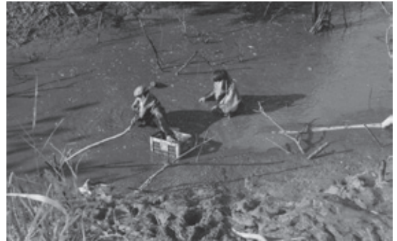
(写真：昭和54年、千代田町内で。神崎市所蔵)

その後、圃場整備に伴いクリークの姿が変わり、こうした風景も今ではほとんど見ることができなくなりました。