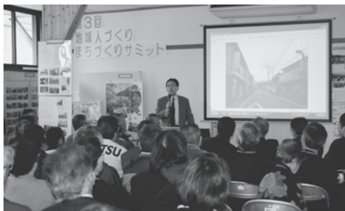
▲CSOかんざき主催の「地域人づくり・まちづくりサミット」

開催の神崎市合併5周年記念式典の折にその活動内容を発表していただくことになっていきます。多くの市民の方々に活動の内容をお聞きいただき、皆さんが自らできることに取り組み、地域活動に参画していただくことをお願いします。