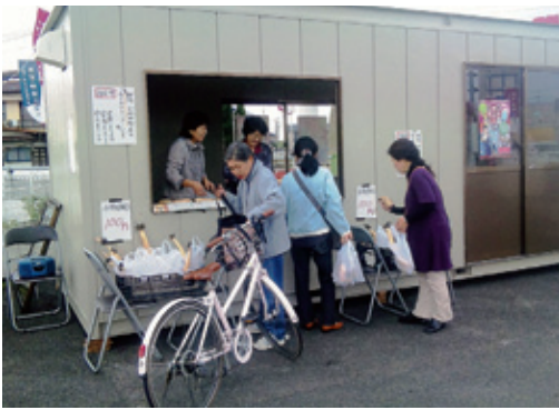
▶レンコンも売れ行き好調

最終日には骨董市出店業者団体から売り上げの一部が大震災復興義援金として神崎市福祉福祉協議会へ贈られました。