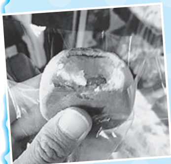
荒木屋さんの できたて栗まんじゅう

お酒の席が最も多くなる年末年始。お好きな方も、苦手な方も、お酒の醸造された背景や豆知識を披露しながらテーブルを囲むと、宴にまた違った楽しみが生まれるものですよ。そんな酒席を演出しようと、