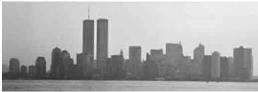
▲マンハッタン島と摩天楼

ニューヨークは経済の街ですが、学問でも高い水準を持っています。その中心的な役割を果たしているのがコロンビア大学であり、セントラルパークの近くにあり、コロンビア大学は教員及び卒業生の中から50名を超えるノーベル賞受賞者を出しています。このような大学がアメリカにはいくつもあります。アメリカの人口は日本の約2倍ですが、ノーベル賞受賞者数は日本の10倍以上です。日本人の資質がアメリカ人に比べて劣っているとは思えないのに、どうしてこのようなことが起こるのでしょうか?理由はいろいろ挙げられますが、その一つは、アメリカが「人種のるつぼ」と言われるほど多民族国家であり、異文化が融合していることです。世界の歴史を見ても、異文化が出会う場所には必ず、学問、芸術、経済の発展が見られます。このような意味から、国際交流や異文化交流は街の活性化や発展のために非常に重要であると思われるます。