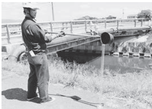
神埼町 本堀都市下水道水質検査結果概要 平均値、( ) はその年の最高(悪)値