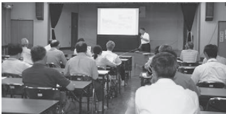
▲脊振公民館での語る会の様子