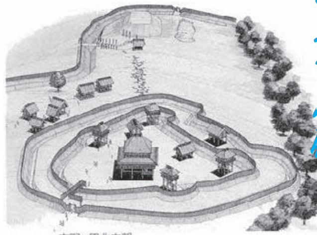
吉野ヶ里北内郭 (弥生時代後期) 建設者(建物等復元検討調査報告書)より引用

北部九州では紀元前2世紀から巫女が社会的、政治的な地位を高めていたことが墳墓の変遷から見て取れます。神埼市の花浦遺跡では貝輪を腕にたくさん巻いたシャーマンが発掘されるなど、弥生時代後期後半3世紀には卓越した婦女が出現しています。