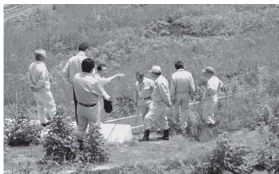
▲城原川堤防（大門付近）の視察

会議終了後、出席者全員で城原川堤防や仁比山地区急傾斜地の工事状況を視察し、担当者から説明を受けました。