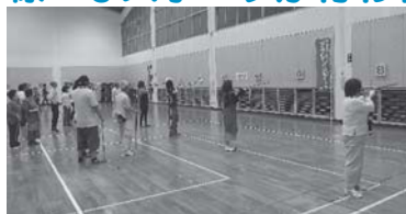
スポーツ吹き矢教室