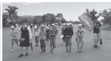
吉野ヶ里歴史公園ウォーキング