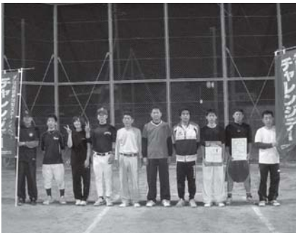
Bパート準優勝 (駅ヶ里)