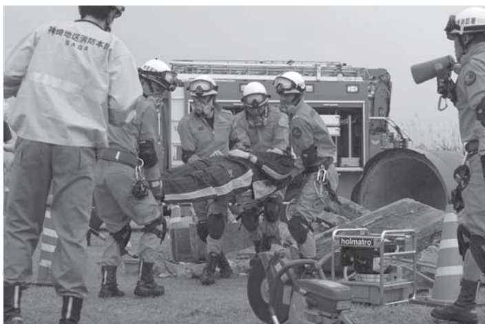
▶ガレキからの救出訓練 ▲釜段工法

模林野火災消火訓練、水防工法訓練に参加。消防署員や自衛隊員と連携しながら、ガレキを撤去し、負傷者を救出したり、釜段工法と呼ばれる、堤防漏水対応技術を披露しました。