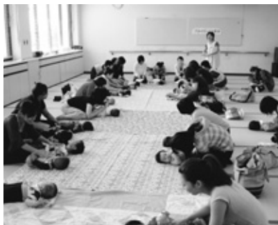
▲「赤ちゃん広場」での様子

◎問い合わせ先 神崎町保健センター ☎51-1234 千代田町保健センター ☎44-2021 脊振総合支所 市民福祉課 ☎59-2111