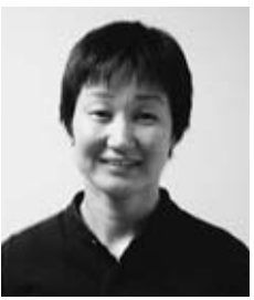
志水見千子さん アトランタ・シドニーオリンピック 女子5000m日本代表