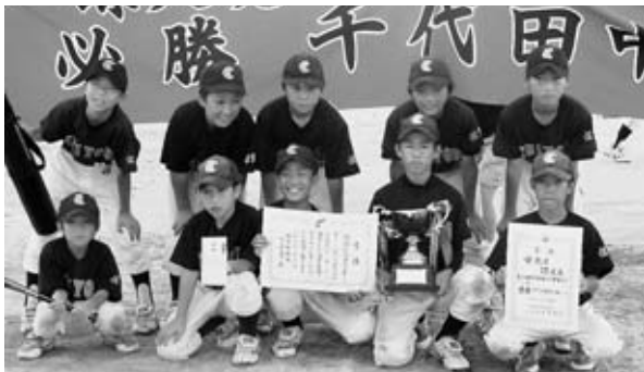
▲1部優勝 千代田中部少年野球クラブ