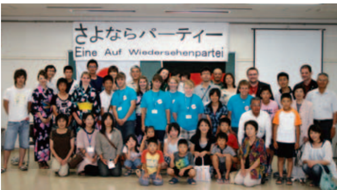
ホストファミリーの皆さん、ありがとうございました。

7月29日から8月2日まで、日独スポーツ少年団同時交流事業が行われ、ドイツから高校生7人が神埼市に滞在し、市内の7家庭でホームステイしました。期間中は、神埼市内の観光、企業見学、市内のスポーツ少年団の子どもたちとのスポーツ交流などを行い、神埼市の歴史や産業を学び、スポーツを通して市内の子どもたちと交流を深めることができました。