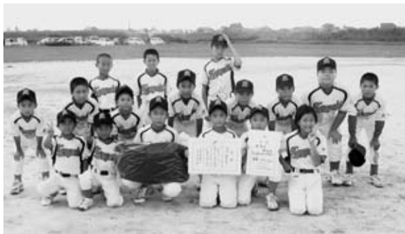
▲2部優勝 神埼球友クラブ