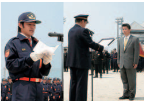
▲新入団員の宣誓 ▲退団者へ感謝状の贈呈