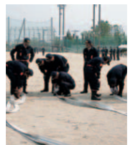
▲ホース延長・結合訓練