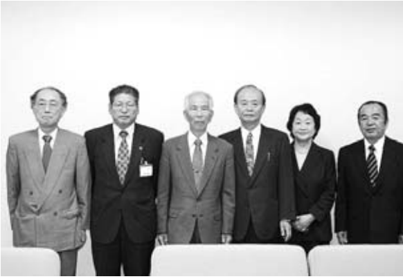
▶右から、村岡委員・實松教育長・津山委員長・宮原委員・市長・永原委員