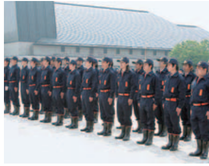
▲新入団員の通常点検訓練▲