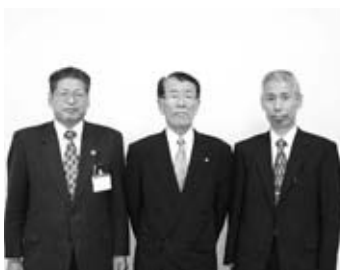
▶右から、倉谷委員・松本委員・市長