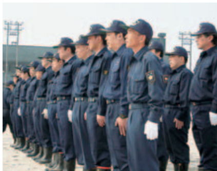
▲部長 通常点検訓練